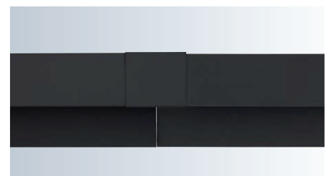
通気見切縁と接合部材 (FTM2188とFTM1188S)