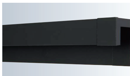
通気見切縁とエンドキャップ (FTM2188とFTM2188C)