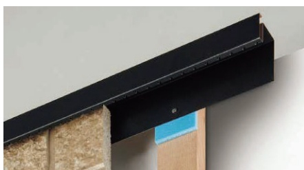
横張り釘打施工の軒天井切部 (FTM2188)